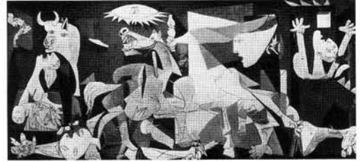
Umschlag / Cover: Pablo Picasso, "Guernica", Endzustand / final state, 1937, Öl auf Leinwand / oil on canvas, 349,3 x 777,6 cm, Centro de Arte Reina Sofia, Madrid.

„GUERNICA“ MYTHOS UND WIRKLICHKEIT. “GUERNICA“, MYTH AND REALITY.